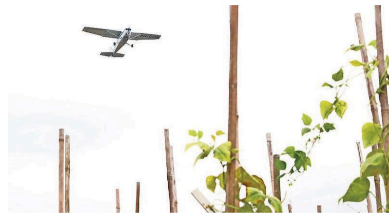
De tuinen liggen naast het vliegveld.